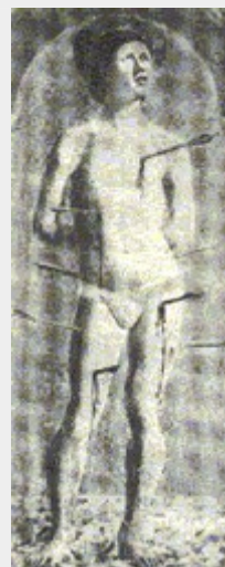
San Sebastiano, Patrono dei Vigili Urbani (Piero della Francesca Pinacoteca S.Sepolcro)