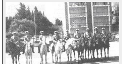
Palermo: il nucleo cavalleggeri della Polizia Municipale (luglio'89)