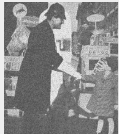
Festa e simpatia alla Befana del vigile urbano