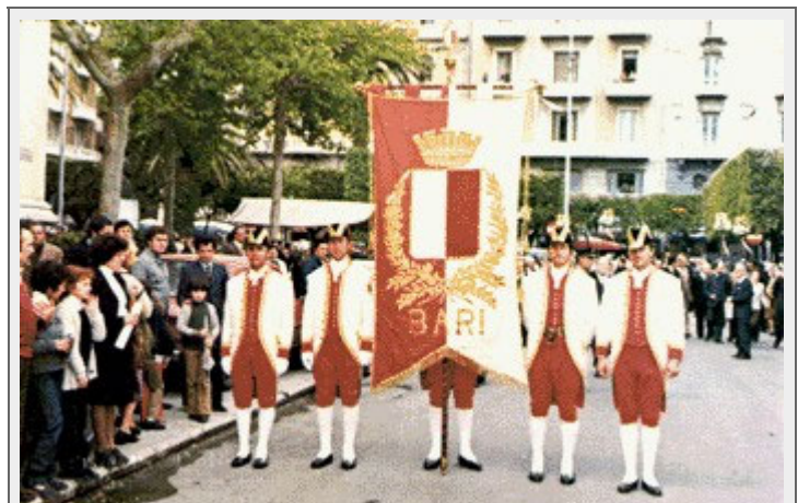
Bari - Uniforme storica : i valletti

Gli anni '90, caratterizzati da profonde trasformazioni socio - politiche, aprono nuovi scenari operativi che evidenziano il superamento storico di molti passaggi normativi della legge 65/86. Con gli istituti contrattuali privatistici cambia anche la legislazione sulla Dirigenza, mutano le tradizionali riserve dell'A.N.C.I., si frantumano le Organizzazioni Sindacali, irrompono nella vita comunale le nuove politiche dei Sindaci, che pensano referenti per la sicurezza pubblica, a fianco di quelle tradizionali. I Vigili vengono richiamati da una nuova serie di incontri convegnuali, organizzati da Sindacati ed Associazioni, impegnati nel lodevole intento di risolvere gli annosi problemi del rischio professionale, delle attività usuranti, degli Albi professionali, del concorso con le Forze di Polizia nei problemi della pubblica sicurezza.