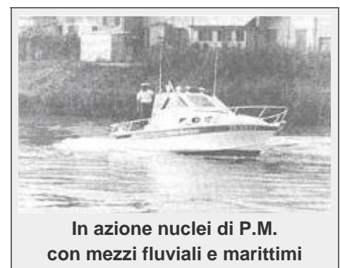
In azione nuclei di P.M. con mezzi fluviali e marittimi

Alle Giornate di studio di Viareggio'86, il Presidente dell'A.N.C.U.P.M. Andreotti ringrazia tutte le Autorità che hanno contribuito alla nascita della legge, che finalmente, ci ha dato un nome...di battesimo preciso e ci esorta a stare " bene in guardia al fine di evitare che il lavoro svolto venga neutralizzato da applicazioni aventi spirito perso da quello della legge stessa". A fine lavori , tutti i partecipanti propongono uno storico O.D.G. con il quale ritengono che la legge costituisca un riconoscimento ed un traguardo importante per la categoria dei vigili urbani che, ora, acquistano una propria fisionomia giuridica nell'ambito delle amministrazioni dalle quali dipendono e nel complesso sociale nazionale. Esprimono la certezza che, in sede contrattuale, l'A.N.C.I. e la F.L.E.L. tuteleranno la intera categoria per quanto riguarda l'applicazione dell'art.10, comma 2 della legge 7 marzo 1986, n.65. La indennità prevista dovrà, in effetti, apportare benefici economici da non poter scindere da quelli morali. In tal senso il Parlamento ed il Governo hanno inteso riconoscere il lavoro svolto dagli appartenenti ai Corpi di polizia municipale (Comandanti, addetti al coordinamento e controllo ed operatori), la natura di tale lavoro, le qualifiche loro attribuite in materia di polizia giudiziaria, di polizia di sicurezza e di polizia stradale e la responsabilità che tali qualifiche comportano, anche ai limiti del sacrificio.