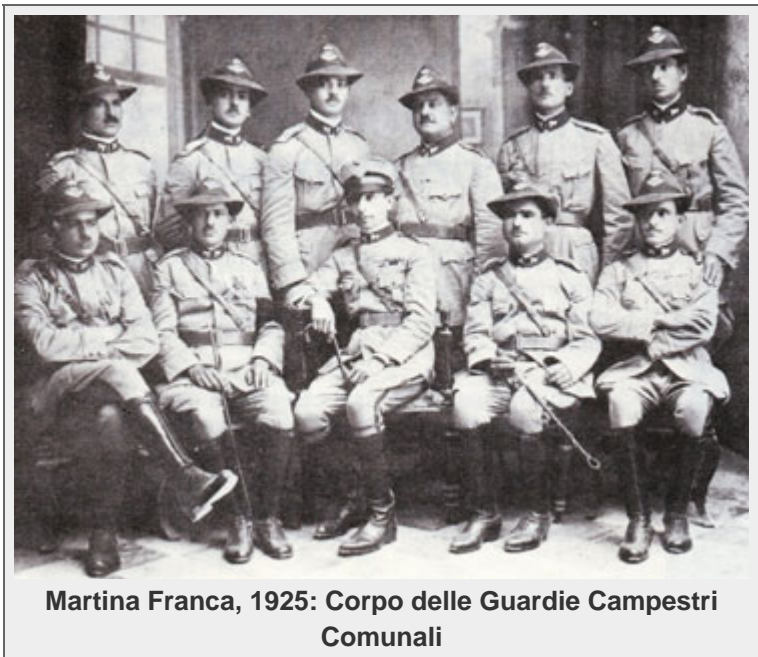
Martina Franca, 1925: Corpo delle Guardie Campestri Comunali

Su di un consuntivo di 1600 unità, ben 746 vennero richiamati a tutto il 30 ottobre 1945, così ripartiti: Esercito 688, Marina 37, Aviazione 21, Caduti in guerra 11, Dispersi 9, trattenuti alle armi 27, Mutilati 14, Feriti 57, Decorati al valor militare 6 ( CROCEVIA , febbraio 46 n.2).