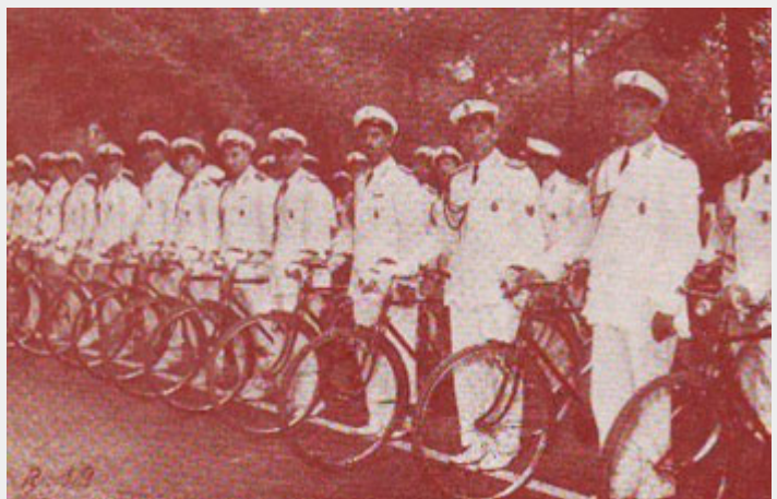
Luglio'49: aggiornamento dell'uniforme con giubba aperta, sostituzione dei numeretti sul colletto con la placca sulla giacca, abolizione dello sfollagente e modifica della foggia del berretto.

A Merano, su iniziativa del Comandante Bruno Balducci, nasce "Crocevia", la prima Rivista dei Vigili Urbani a diffusione nazionale, poi passata a Verona, sotto l'abile regia del Comandante del Corpo, Dante Compri.