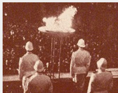
Vigili Urbani in alta uniforme di scorta alla Fiaccola Olimpica