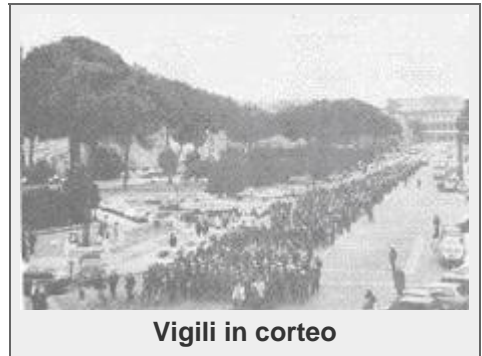
Vigili in corteo