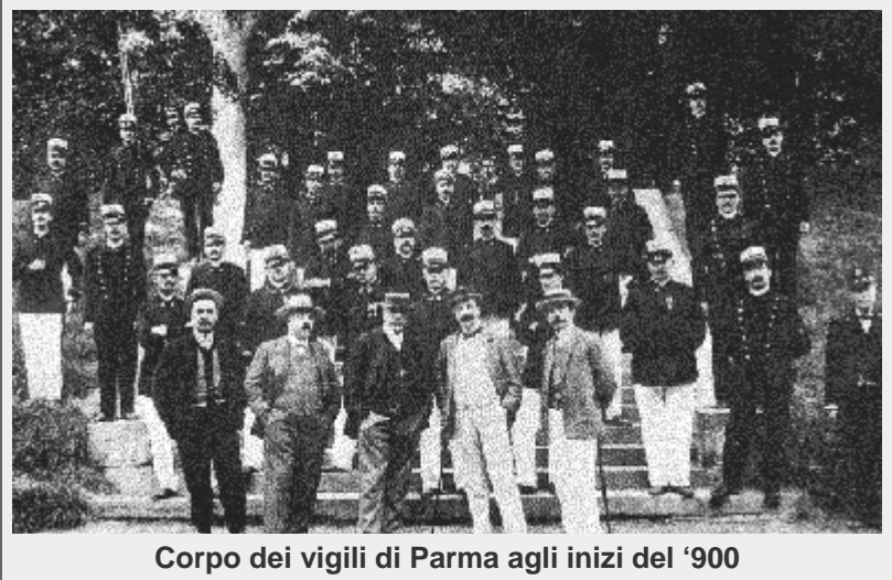
Corpo dei vigili di Parma agli inizi del '900

Avvenuta l'annessione delle province meridionali al Regno di Sardegna - proclamato "d' Italia" nella prima seduta del nuovo Parlamento Nazionale, tenuta a Torino l'8 febbraio 1861, molti Consigli comunali di tutt'Italia cominciano ad adeguare l'Amministrazione cittadina alle Istituzioni Unitarie e , in applicazione della legge comunale e provinciale sarda n. 3702 del 23 ottobre 1859, deliberano la formazione di drappelli e Corpi di Guardie Municipali, con il compito di prevenire e reprimere i reati, far osservare i regolamenti e le ordinanze delle Autorità di polizia